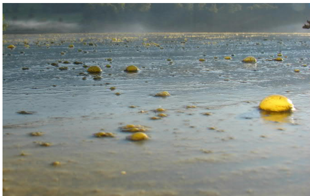
Efflorescence de dinoflagellés de type Peridininopsis dans le lac de Hallwil (C. Furginé)