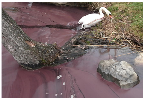
Traînées pourpres sur les rives du lac de Hallwil causées par des filaments d'algues bleues de type Plankthotrix rubescens