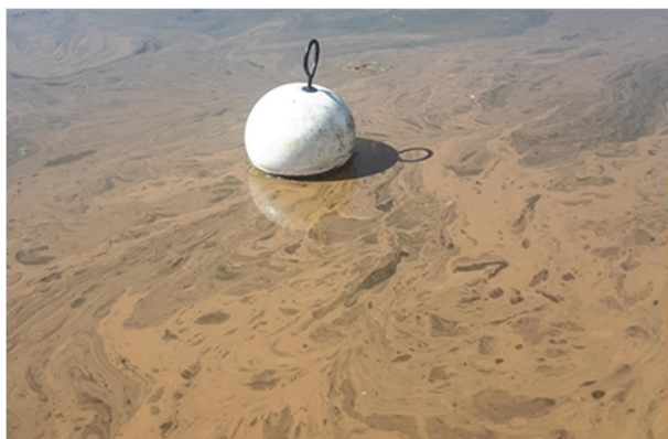
Traînées brunâtres dans le port de Morat (2020) causées par une efflorescence de Woronichinia (C. Folly)