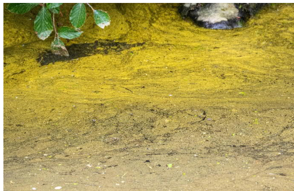
Des traînées jaunes composées de poussières de pollen et de résidus de terre apparues après des précipitations (2021)